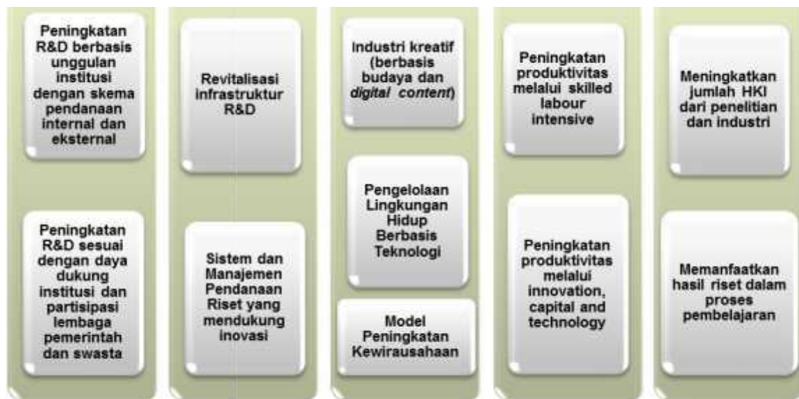
Gambar 1. Road Map Kegiatan Penelitian dan PKM FKIP UMB

Tahapan untuk mencapai target dijelaskan pada diagram roadmap berikut.